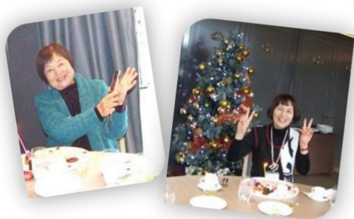
ハッピーバースデー♪

堂島川とレトロな大阪中央公会堂を目前にガラス張りのシックなレストラン「sumile OSAKA」に入ると、まずはウェルカムドリンク。日頃の喧騒を忘れ、ゆったりとした気分で美味しいランチを頂きました。