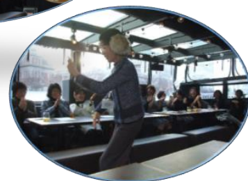
「最後の×は阿波踊り!!」

例会後は「リバークルーズ・PEACE」に乗船。水上から大阪の街並みを眺め、水都大阪の魅力を再発見？ ドリンクを頂きながらお話に花が咲き、最後はNさんの阿波踊りで楽しい野外例会の幕が下りました。